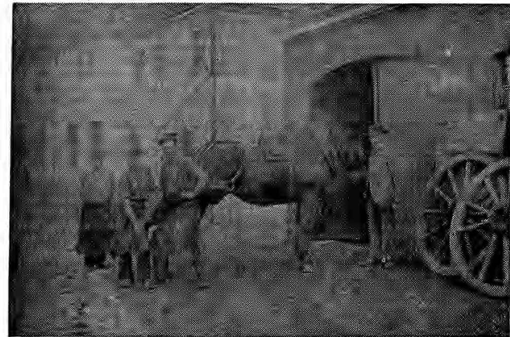
Diese Aufnahme datiert aus den Jahren vor dem ersten Weltkrieg und zeigt die Gebrüder Mathar mit ihrem Vater beim Beschlagen eines Pferdes vor der Schmiede

Die Reservierung der Plätze kann im Kaufhaus »Au Printemps« vorgenommen werden.