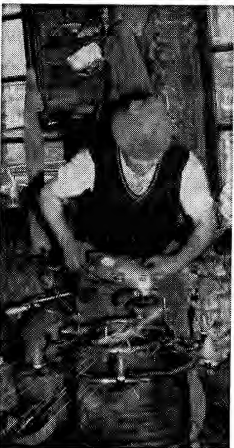
Der jetzige Pächter führt die Arbeiten in der Schmiede weiter, konzentriert sich aber auf die Anfertigung von kunstgewerblichen Gegenständen. Hier bei der Herstellung eines Kronleuchters in Schmiedeeisen

In ganz Eupen waren um das Jahr 1900 bis nach dem Ersten Weltkrieg mehr als ein Dutzend Schmieden zu finden, die Hauptschmiede war jedoch die auf der Judenstrasse. Dort spielte sich auch das Gesellschaftsleben ab, denn hier traf sich die halbe Stadt, und hierhin kamen auch die meisten Fuhrleute aus der Umgebung. Während die Pferde beschlagen wurden, hatte man genügend Zeit zu einem gemütlichen Plausch; die Neuligkeiten wurden ausgetauscht, Geschichten wurden erzählt, und eine gute Flasche Brantwein durfte natürlich auch nicht fehlen. Die Kinder aus der Nachbarschaft hatten ihren Spielplatz in der Schmiede. Dort amüsierten sie sich am besten, und dort konnte man sich auch so schön schwarz und dreiklig machen. Die Arbeiter störte das nicht,